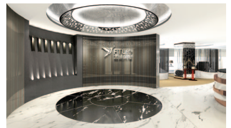
體驗最新落成之富薈客戶服務中心