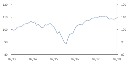
■ AM類 (美元) 收息股份