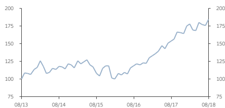
■ A類 (美元) 收息股份