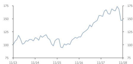
■ A類 (美元) 收息股份