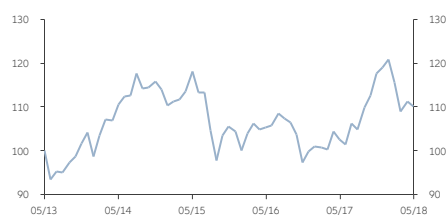
■ AT類 (美元) 累積股份