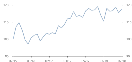
■ AM類 (歐元) 收息股份